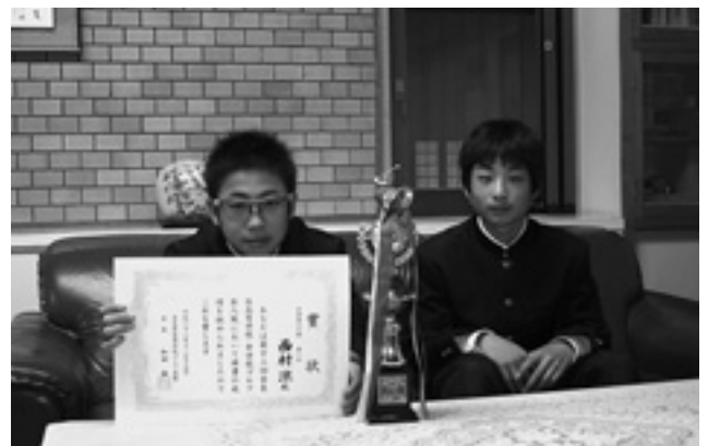
報告に訪れた西村君と後呂君